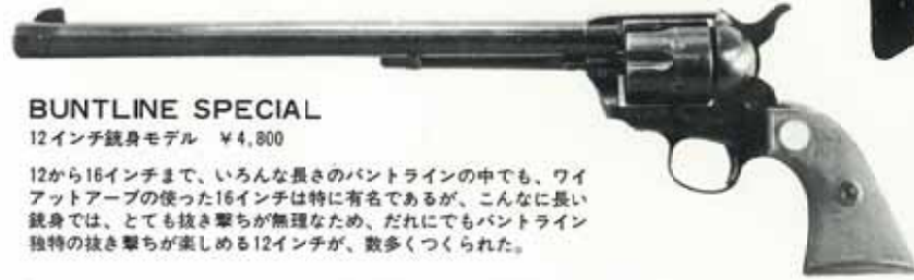
BUNTLINE SPECIAL 12インチ銃身モデル ¥4,800

12から16インチまで、いろんな長さのバントラインの中でも、ワイアットアープの使った16インチは特に有名であるが、こんなに長い銃身では、とても抜き撃ちが無理なため、だれにでもバントライン独特の抜き撃ちが楽しめる12インチが、数多くつくられた。