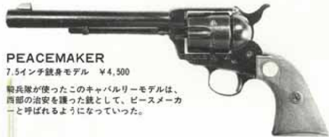
PEACEMAKER 7.5インチ銃身モデル ¥4,500

12から16インチまで、いろんな長さのバントラインの中でも、ワイアットアープの使った16インチは特に有名であるが、こんなに長い銃身では、とても抜き撃ちが無理なため、だれにでもバントライン独特の抜き撃ちが楽しめる12インチが、数多くつくられた。