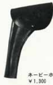
ネービーホルスター ¥1,300