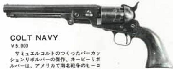
COLT NAVY ¥5,000

サミュエルコルトのつくったパーカッションリボルバーの傑作、ネービーリボルバーは、アメリカで南北戦争のヒーローとして、開拓時代の代表的なアンティークモデルといえるだろう。