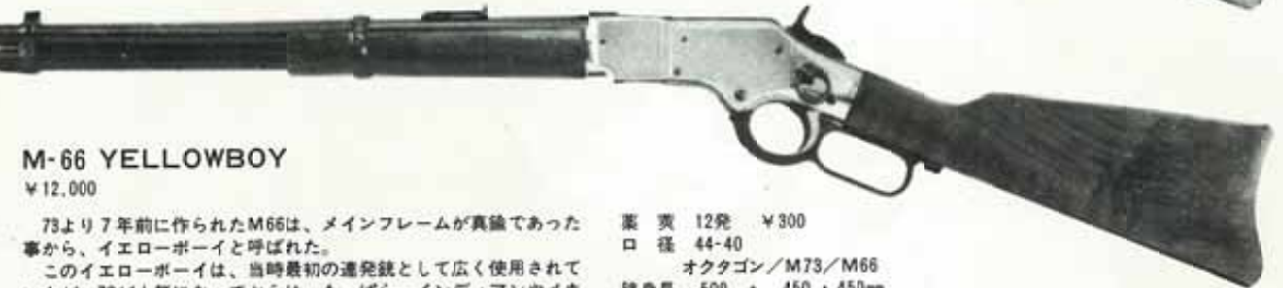
M-66 YELLOWBOY ¥12,000

スタンダードモデルは、西部劇独特のレバーアクションが楽しめるように、丈夫なメカニズムと、もっともふり回しやすい17インチの銃身をもった軽快なサドルカービンです。