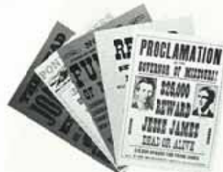
手配書 ¥300 (1組)