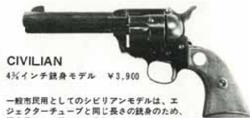
CIVILIAN 4 1/2インチ銃身モデル ¥3,900

カウボーイ達が愛用したフロンティアモデルは、腰のホルスターから抜きやすいように、少し銃身が短かく、最もポピュラーな拳銃