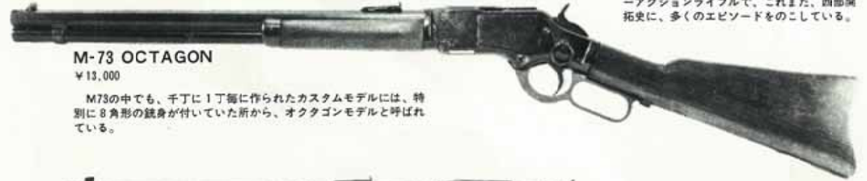
M-73 OCTAGON ¥13,000

M73の中でも、千丁に1丁毎に作られたカスタムモデルには、特別に八角形の銃身が付いていた所から、オクタゴンモデルと呼ばれている。