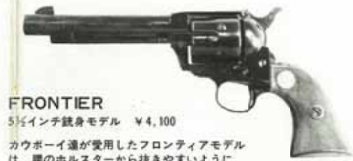
FRONTIER 5 1/2インチ銃身モデル ¥4,100

騎兵隊が使ったこのキャバルリーモデルは、西部の治安を護った銃として、ピースメーカーと呼ばれるようになっていった。