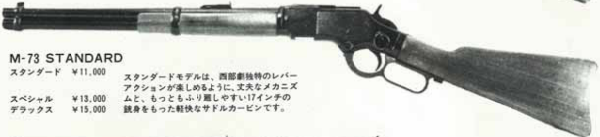
M-73 STANDARD スタンダード ¥11,000

M73の中でも、千丁に1丁毎に作られたカスタムモデルには、特別に八角形の銃身が付いていた所から、オクタゴンモデルと呼ばれている。